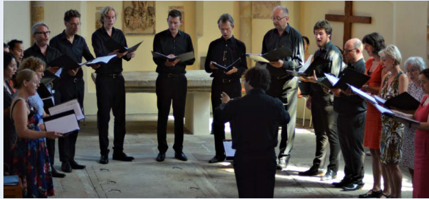
Vocaal Ensemble La Colombe o.l.v. Iassen Raykov